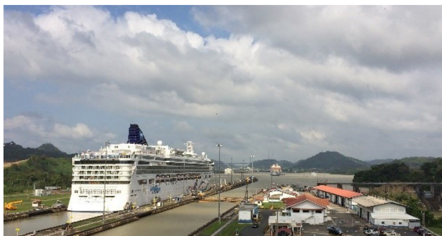
22 Febbraio : Transito parziale sul Canale di Panama

Partenza dall'Italia con volo di linea Iberia per Panama. Arrivo all'aeroporto internazionale di Tocumen, incontro con il rappresentante locale per trasferimento in auto privata in hotel situato a Panama City. Registrazione e consegna del kit informativo. Sistemazione: Hard Rock Hotel