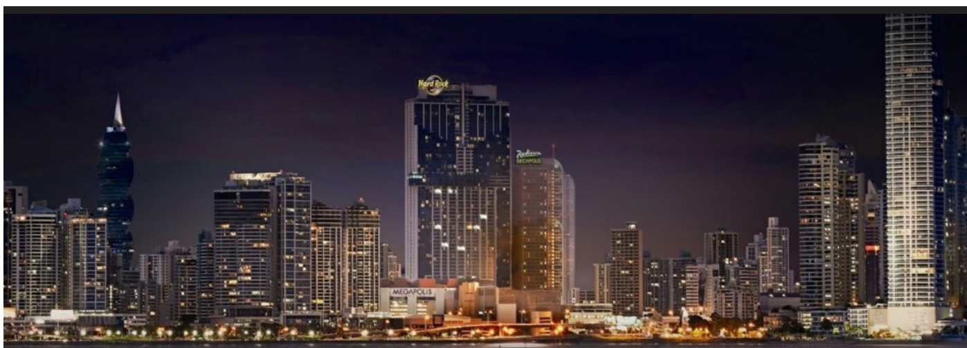
29 Febbraio : Volo per Panama

Dopo colazione trasferimento all'aeroporto di Bocas per ritornare a Panama. All'arrivo, trasferimento privato all'albergo.