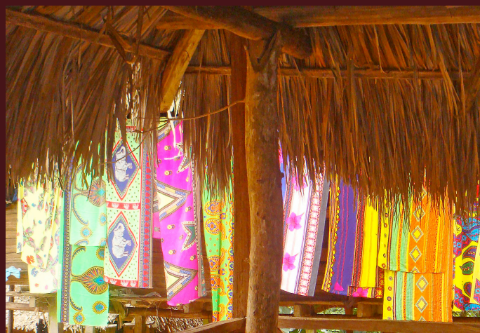
24 Febbraio : Visita della comunità indigena Emberà Drùà

Giorno libero per girare nella città di Panama, in occasione della sfilata di Carnevale. E' la tradizionale manifestazione della incoronazione della regina del Carnevale a dare inizio ai festeggiamenti che proseguono poi con la variopinta sfilata in maschera del martedì Grasso, durante la quale carri e costumi di ogni colore, genere e dimensione animano le strade della città sino a notte fonda, lasciando di stucco grandi e piccoli. Una manifestazione di grande suggestione che lascia una piacevole sensazione di coinvolgimento e spiritualità.