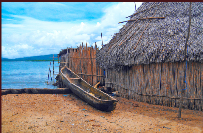
1 Marzo : Panama City

Di mattina presto, trasferimento all'aeroporto nazionale di Albrook per il volo a Playón Chico.