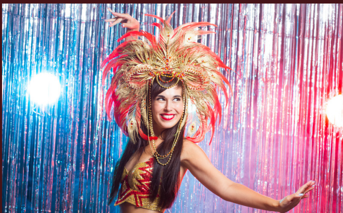
25 Febbraio : Carnevale

Incluso pranzo, guida, trasporto privato ed entrata al Centro de Visitantes de Miraflores.