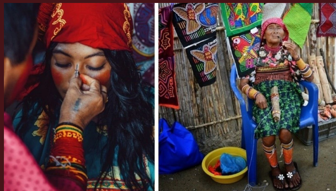
2-3 Marzo : Playón Chico

Giornate a disposizione per godervi il tempo come da vostri desideri.