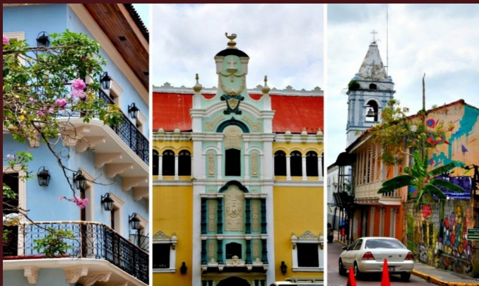
23 Febbraio : Panama City

Durante la mattinata visiterete le rovine di Panamá Viejo. Salirete sulla torre della cattedrale, e visiterete il museo di arte coloniale e il "Casco Viejo".