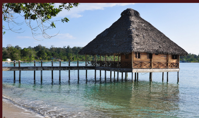
26 Febbraio : Volo per Bocas del Toro

Incluso pranzo tradizionale con la comunità locale, guida e trasporto privato.