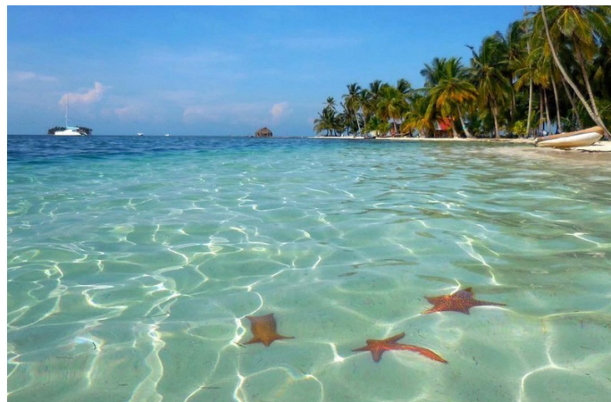
28 febbraio : Giorno libero a Bocas del Toro

Dopo colazione passerete nel parco Nazionale Marino Bastimentos. Avrete l'occasione di fare immersioni, godervi la spiaggia e rilassarvi al sole. Nel pomeriggio potrete camminare tra le mangrovie del parco fino ad arrivare a Isla Bastimento e qui godervi la selvaggia spiaggia famosa per le sue rane rosse.