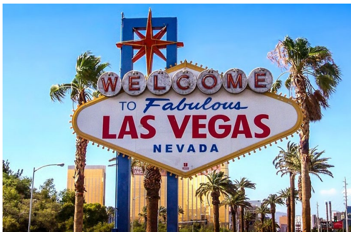
Settimo giorno LAS VEGAS

Prima colazione in hotel. Al mattino visita con guida di Las Vegas (tour panoramico della città). Pranzo libero. Pomeriggio a disposizione per rilassarsi o per visite individuali con accompagnatore a disposizione. Cena in hotel. Serata libera con accompagnatore a disposizione. Pernottamento.