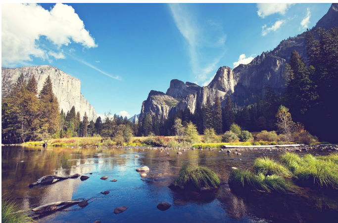
Nono Giorno MAMMOTH LAKES - YOSEMITE PARK - SAN FRANCISCO

Prima colazione in hotel. In mattinata partenza per Death Valley, un parco nazionale molto popolare nel Nevada. Si visiterà la famosa valle, sita sotto il livello del mare. Pranzo libero. Arrivo in serata a Mammoth Lakes. Cena in hotel. Serata libera con accompagnatore a disposizione. Pernottamento.