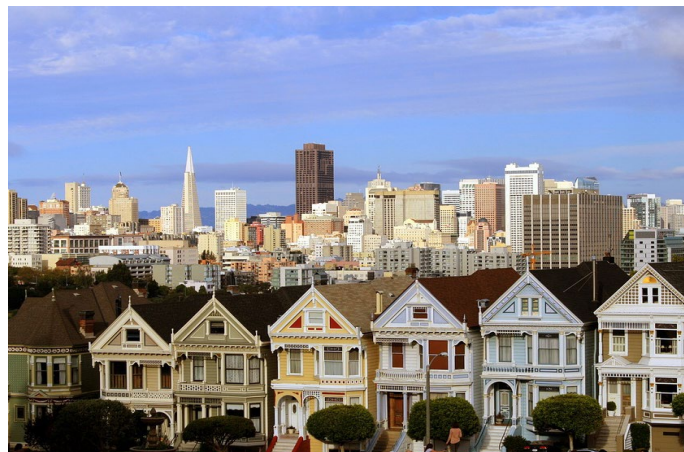
Decimo giorno SAN FRANCISCO

Prima colazione in hotel. Al mattino visita dello Yosemite Park, noto per le sequoie giganti. Pranzo libero. Nel pomeriggio trasferimento a San Francisco e cena in ristorante. Serata libera con accompagnatore a disposizione. Pernottamento.