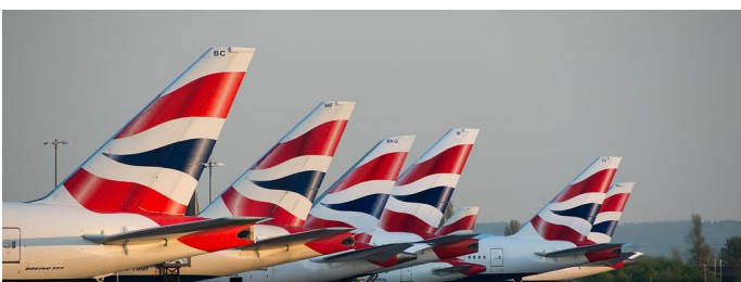
Undicesimo Giorno SAN FRANCISCO - ITALIA

Prima colazione in hotel. L'intera giornata sarà dedicata alla visita guidata della città e delle sue più famose attrazioni: Pier 39, Cable Car, Lombard Street, Golden Gate, le case vittoriane di Alamo Square, i quartieri di Castro e Chinatown, escursione a Sausalito e Muir Woods. Pranzo libero. Cena in ristorante. Dopo cena sarà possibile partecipare al "San Francisco by night", un tour panoramico con bus privato e guida. Pernottamento.