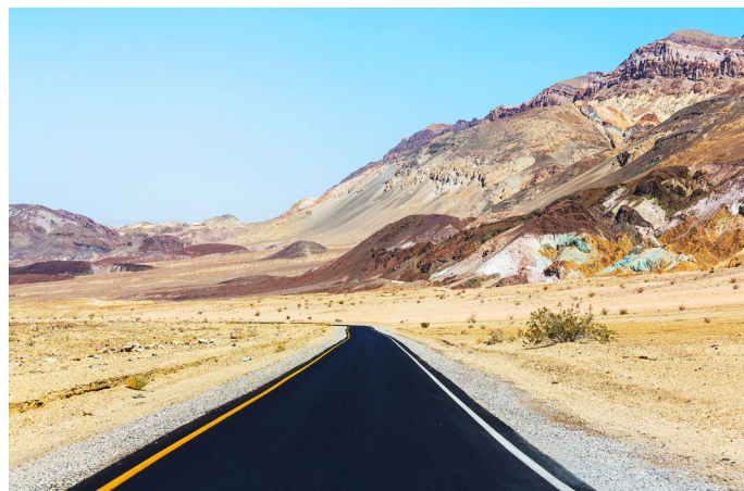
Ottavo Giorno LAS VEGAS - DEATH VALLEY - MAMMOTH LAKES

Prima colazione in hotel. Al mattino visita con guida di Las Vegas (tour panoramico della città). Pranzo libero. Pomeriggio a disposizione per rilassarsi o per visite individuali con accompagnatore a disposizione. Cena in hotel. Serata libera con accompagnatore a disposizione. Pernottamento.